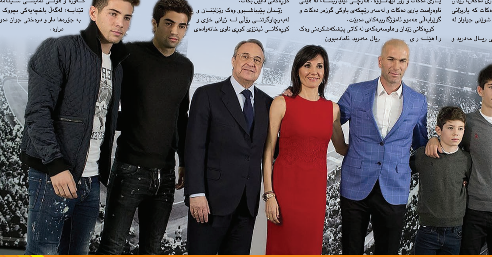
نەھینی ھەزەدەکە یانیزانی..

ھەلبژاردە ئیسپانیایە، بوونی بە گۆلیاریز نیشانە پرسپاری دروستکرد، چونکە خەلکی پشپشپنیان دەکرد بێر لەو بەکاتەو ببیتە ھیرشەر یان یاریزانی ھیلی ناوەراست. ئینژو زیدان، ھیرشەر و نوای دروشانەو لە ماوی نوایی رۆژنامەکان تیشکیان خستە سەری، خەلکیکی زۆریش سەری ئەو گرە ئیدیوانە ھەندێ گۆلەکانیان کرد کە لەگەل یانەکە تۆماری کردوون، ھەرەھا زیدان بەپەروش بوو ناوی خیزانی ھاوسەرەکە لە کورەکی بنیت کە بە ئینژو ڤیراندنیز ناسراو. تیۆ زیدان، ھەندیکار لە بالەکان و ھەندیکاریش لە ناوەراست یاری دەکات و زۆر ئیلتاویو. ھەرچی ئیلتاویش، لە ھیلی ناوەراست یاری دەکات و لەسەر ریککی باوکی گۆرە دەکات و گۆرایەلی ھەموو ئامۆزگاریەکانی دەبیت. کورەکانی زیدان و ھاوسەرەکە لە کاتی پشکەشکردنی وەک ران ھیتەری ریاڵ مەدرید ئامادەبوون